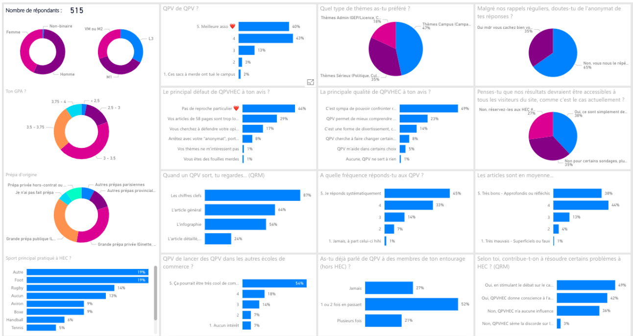
FIGURE 21.1 – Résultats globaux (515 répondants)