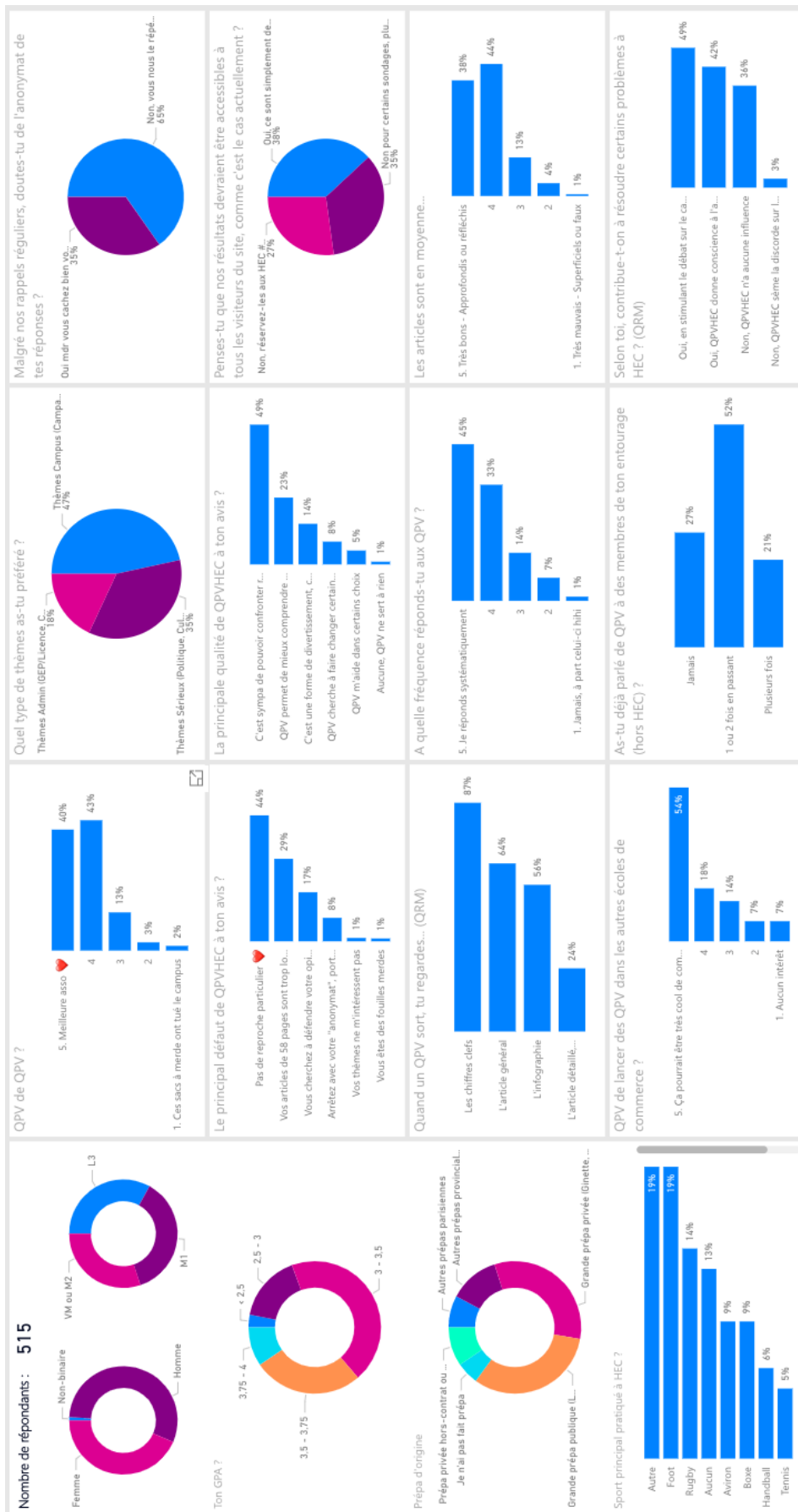
FIGURE A.5 – Capture d'écran du tableau de bord Power BI présentant les résultats du sondage « QPVHEC »