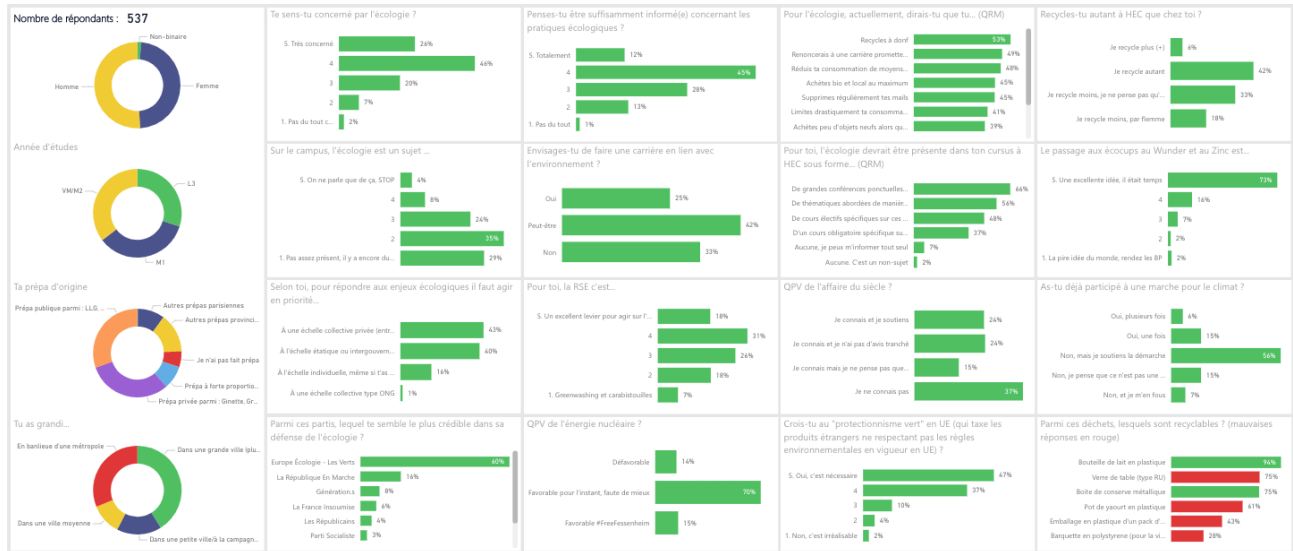
FIGURE 22.1 – Résultats globaux (537 répondants)

Nous rappelons que – comme pour tous nos sondages – les échelles de satisfaction vont de 1 à 5. Par conséquent, la moyenne n'est pas à 2,5/5 mais à 3/5. L'analyse doit prendre en compte cette particularité.